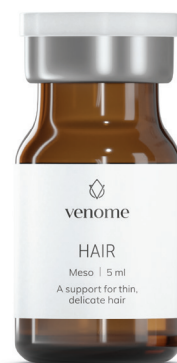
VENOME MESO HAIR

Venome Meso HAIR to idealna kompozycja do wzmocnienia słabych i delikatnych włosów. Efektem stosowania mezokoktajlu jest uzupełnienie niedoborów witaminowych, poprawa nawilżenia, wzmocnienie elastyczności włosów oraz zminimalizowanie wypadania.