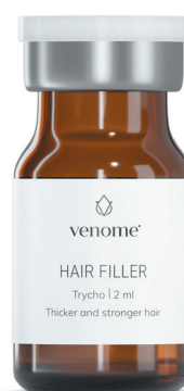
VENOME HAIR FILLER