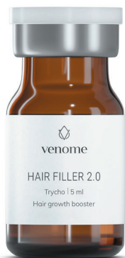
● VENOME HAIR FILLER 2.0