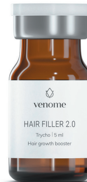
VENOME HAIR FILLER 2.0

Dwuetapowy zabieg oparty na naprzemiennej kuracji Venome Hair Filler oraz Venome Hair Filler 2.0 . Zastosowanie obu preparatów w terapii wpływa na intensywną stymulację cebulek, wzmocnienie trzonów włosów, uzupełnianie braków keratyny i wzmocnienie mostków dwusiarczkowych oraz utrzymanie jak najdłuższego efektu estetycznego zabiegu.